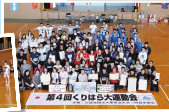
※写真は前回開催時の様子を掲載しています