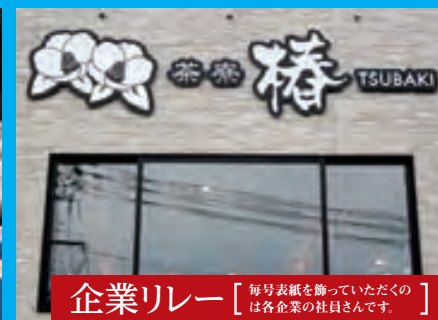
企業リレー 【 毎号表紙を飾っていたくのは各企業の社員さんです。】