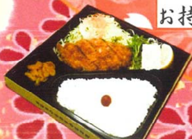
中コースかつ弁当

こちらに載っていないメニューのお持ち帰りの料金は、メニュー表の中の表示価格 (単品も含む) になります。お持ち帰りできないメニューもありますので、ご了承下さい。