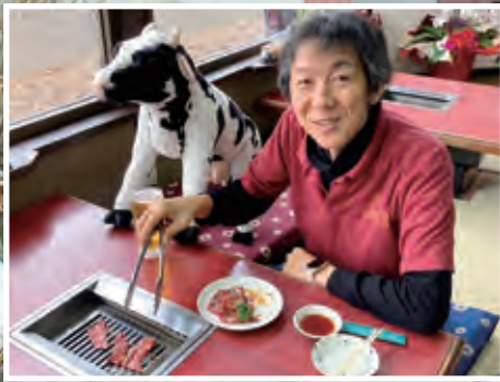
企業リレー 【毎号表紙を飾っていただくのは各企業の社員さんです。】