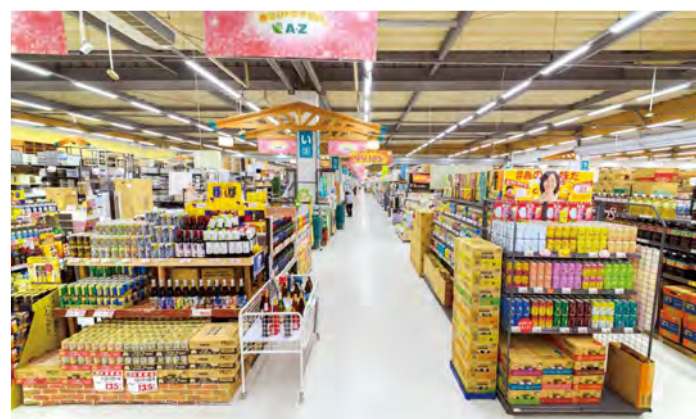
商品の配置が分かりやすいよう、整然とレイアウトされている店内

実は、この仕事を始めたのは自分の意思ではなかったんです。弟がやってきたホームセンターを手伝うため、私は当時勤めていた自動車関係の会社を辞めて東京から帰ってきたんです。そうしたら驚くことに物価が関東よりも高い。商品も古くてホコリをかぶっている。そんな状況を知り、これこそ天職だと自身を納得させ、地元の皆さんのために何をしたらいいかと考えたんです。ホームセンターは既に大きな負債が出ていたので、まずそれをなんとかしないといけない。小売業の経験は全くないけれど、もう開き直ってやるしかなくて、そんなスタートでしたから、一年も持たないだろうとか、いつ倒産してもおかしくないと噂されました。常に倒産を意識しながらやってきて、安定したのは3年目ころからです。 日本の高度成長期に幾つかの大きなスーパーが出来て、豊かな経済をつくり上げた。だから今さら私らが先輩たちの後を追い掛けてもしょうがない。たとえ追い着いてもまた離されて押しつ