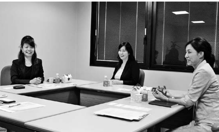
女性の率直なトークが展開された座談会

ぶすのにとっても苦勞しました。とはいつても、法人会に携わって一生懸命動くことで少しづつ顔と名前を覚えていただきました。さらに34、35歳で本会の常任理事、その後青年部会長になり、今度は役員になって会のために一生懸命やることでようやく理解が深まっていく。そうした積み重ねがあつて、皆さんから信頼、信用を得ることができ、仕事にもつながってきたのかなと思つています。