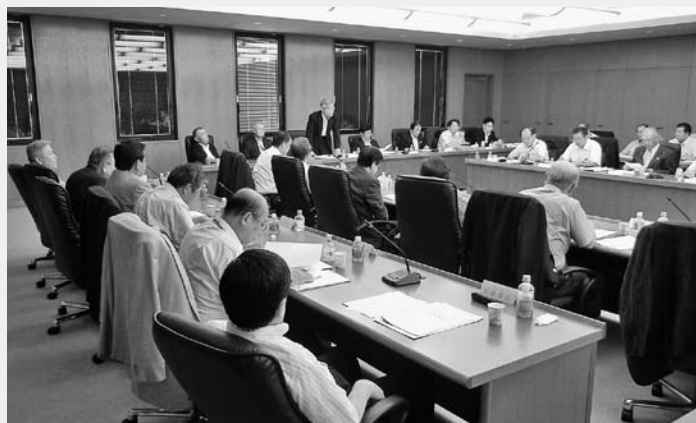
税制改正提言を審議する全法連税制・税務委員会

れば恒久財源の確保を原則とすべきで、具体的財源は税制全般の改革の中で検討されることが望ましい。 (1) 法人実効税率20%台の実現。 (2) 代替財源として課税ベースを拡大するに当たっては、中小企業に十分配慮すべきである。