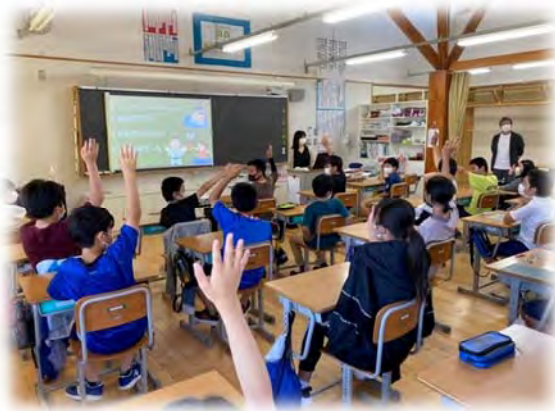
市内小学生を対象とした租税教室