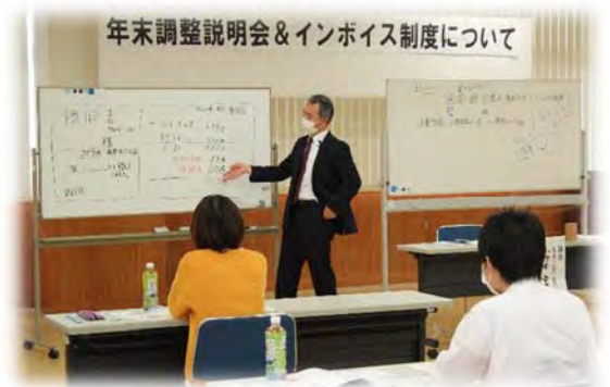
年末調整説明会&インボイス制度について