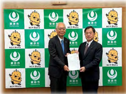
市長と議長へ税制正要望陳情