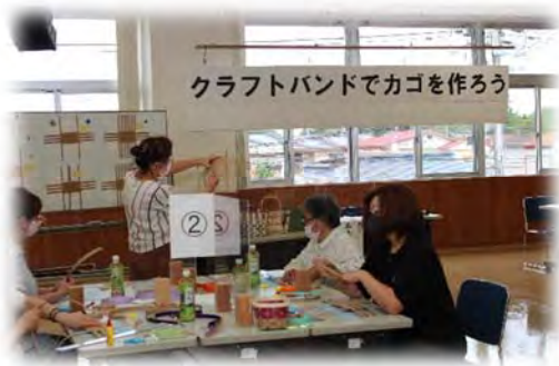
クラフトバンドでカゴを作ろう