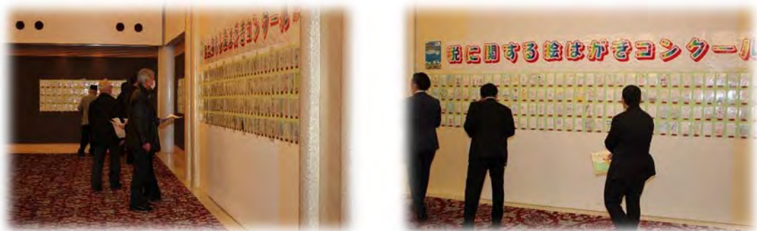
絵はがきコンクール審査会