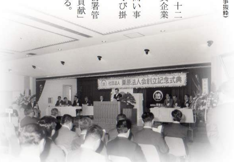
社団法人栗原法人会創立記念式典(昭和56年)