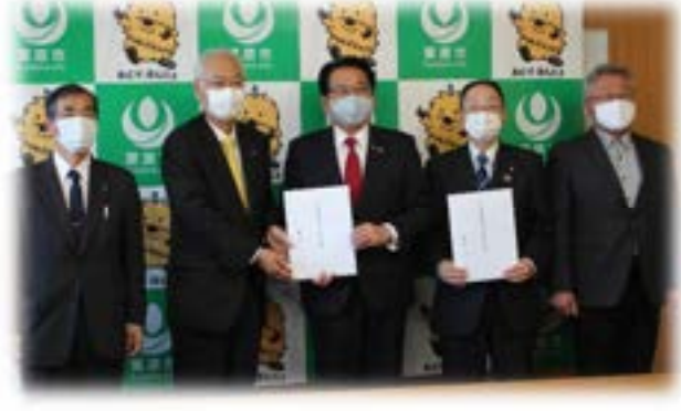
市長と議長へ税制改正要望陳情