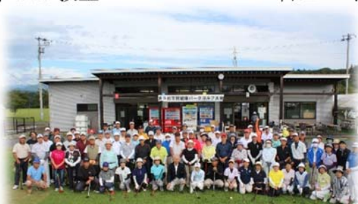
市民健康パークゴルフ大会