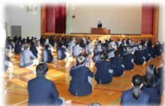
一迫商業高等学校全校集会時表彰