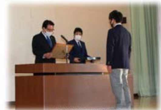
一迫商業高等学校