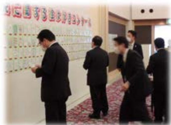
絵はがきコンクール審査会