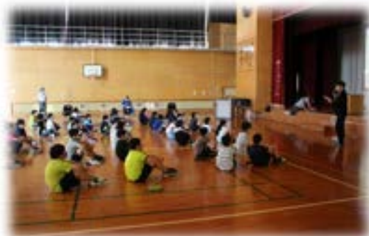
市内小学生を対象とした租税教室